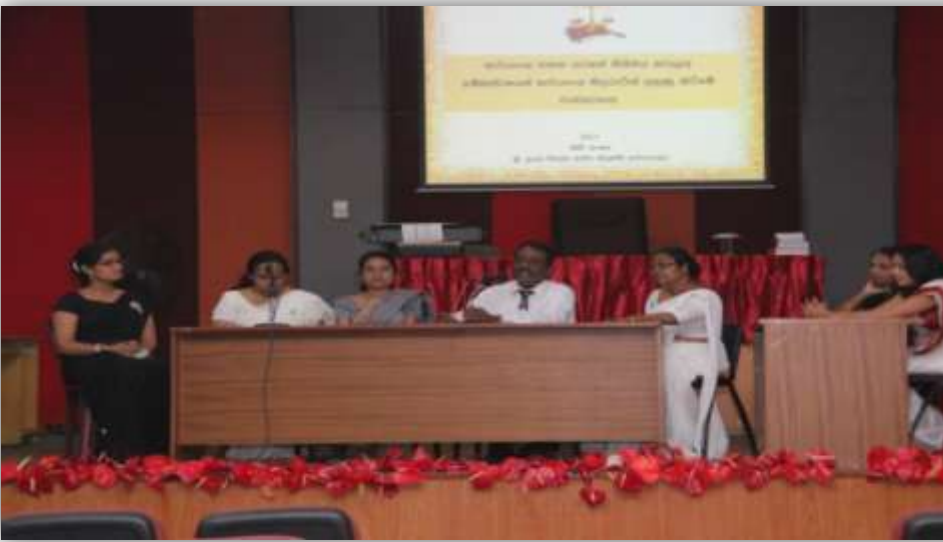
කාර්යාල නිලධාරීන් දැනුවත් කිරීමේ වැඩසටහන