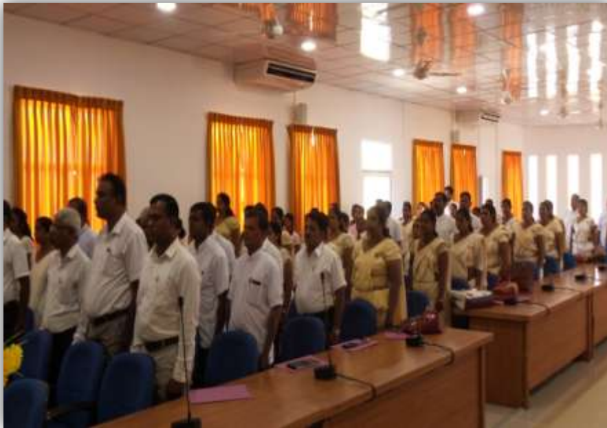
ජ්‍යෙෂ්ඨ ලේකම් කාර්යාල නිලධාරීන් දැනුවත් කිරීම - අම්පාර