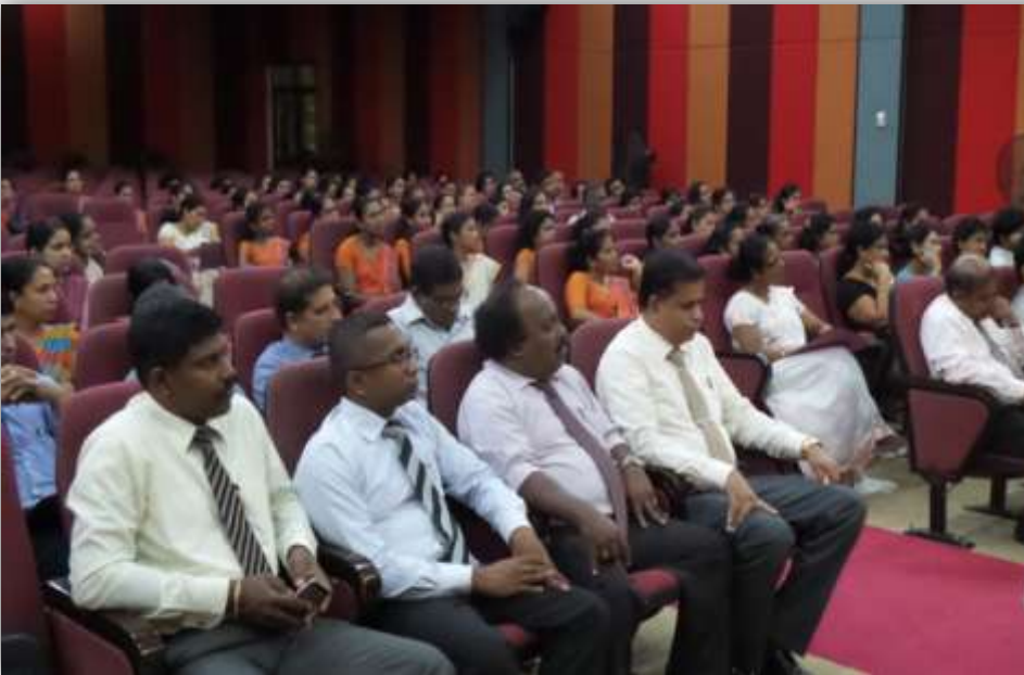
කාර්යාල නිලධාරීන් දැනුවත් කිරීමේ වැඩසටහන