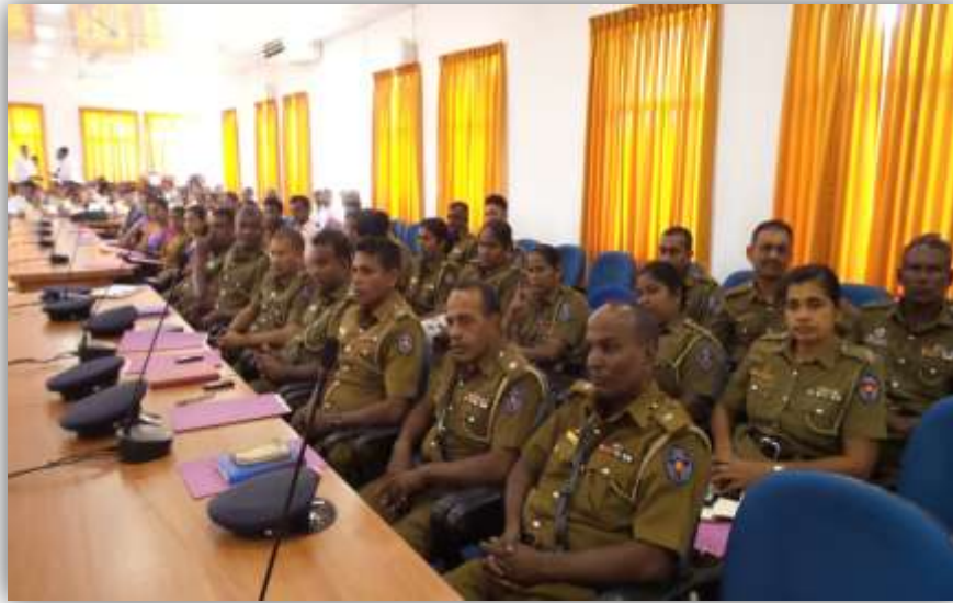
පොලිස් නිලධාරීන් දැනුවත් කිරීම - අම්පාර